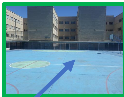
ESO Y BTO